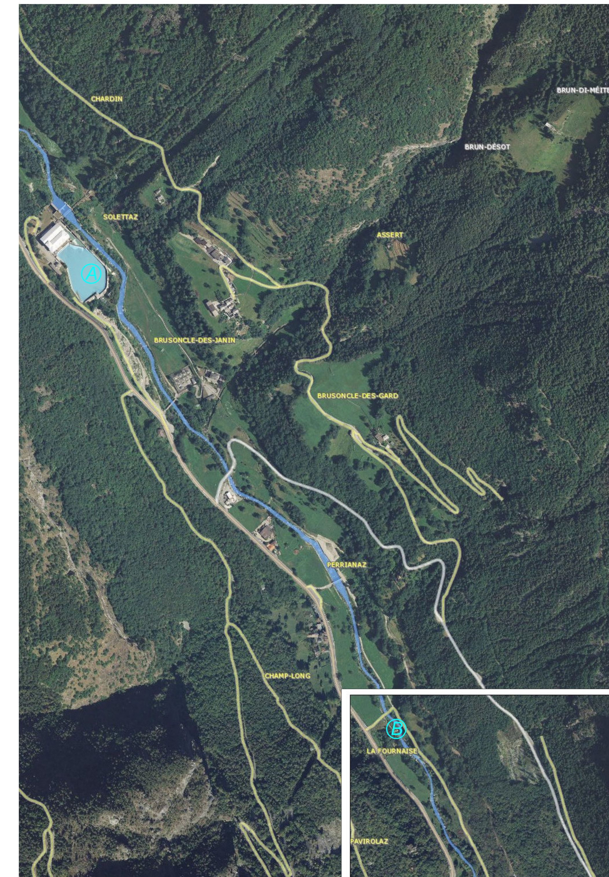
Stampa realizzata tramite GeoNavigatori progetto SCT -